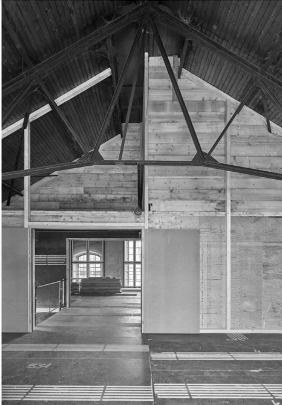
Künstleratelier im alten Gaswerk